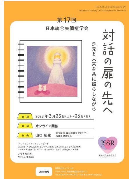
図1 第17回大会のフライヤー

2023年3月25,26日に第17回日本統合失調症学会が開催され、無事終了することができました。第17回大会は、前年度に開催された第16回大会が掲げた「当事者・家族との協働」や「対話」という意志を受け継いだ大会でした。第17回大会は、前回大会の「協働」と「対話」をさらに進めることを目指し、「対話の扉の先へ」という主題を掲げ、多様な立場の方が足元にある課題を見つめながら、研究が照らす未来を一緒にみていくことを副題として設けました（図1）。本報告では、第17回大会の概要や経緯、「社会実験」として試みた工夫などを紹介したいと思います。